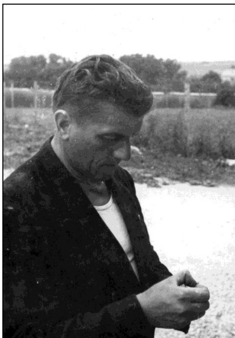
kontrola zrelosti zrna

Hasiči, neskôr požiarnici, boli jeho srdečnou záležitosťou po celý život. I keď v určitom období bola stagnácia tejto organizácie, on niesol odkaz ďalej. Neskôr prišlo znovuzrodenie hasičov, pod hasičskú zástavu prešla aj Dychová hudba