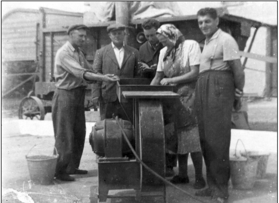
mlatba voľakedy, pán učiteľ l. sprava

Ďalšie otcove záľuby boli lietajúce – boli to včielky a holuby. Ako dnes ho vidím s včelárskou kuklou na hlave, my – deti v bezpečnej vzdialenosti – čakajúce na med a súše. Škoda, že sme si nevypestovali vzťah ku včielkam,